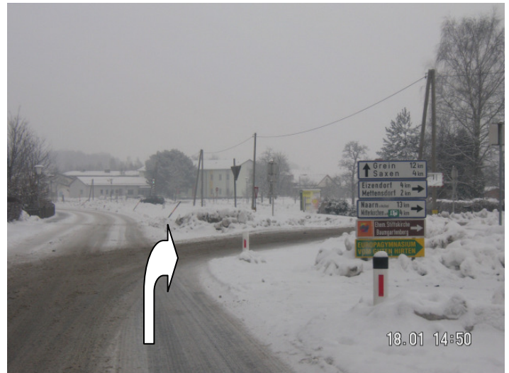
folgen Sie dem Straßenverlauf und biegen Sie nach Nah&Frisch Kaufhaus rechts über Bahnübergang Richtung Mettensdorf ab