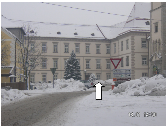
nach ca. 40m (Klosterplatz) gerade aus Richtung Mettensdorf