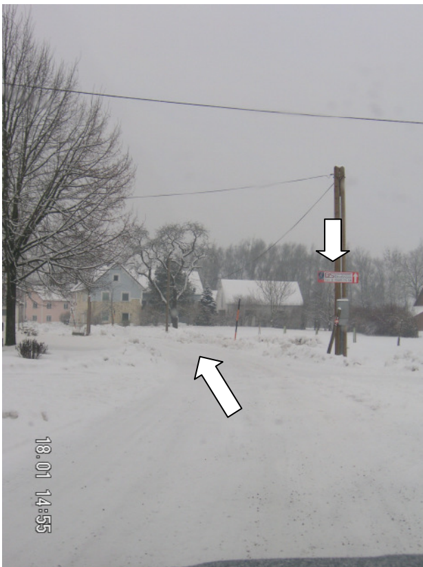
folgen Sie dem Straßenverlauf (siehe Wegweiser)