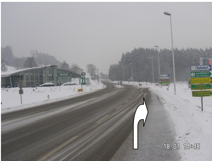
B3 Ortseinfahrt Baumgartenberg (gegenüber Autohaus Skoda Gmeiner) rechts abbiegen

Unseren Standort in 4342 Baumgartenberg, Mettensdorf 15 erreichen Sie von Perg kommend auf der B3 wie folgt: