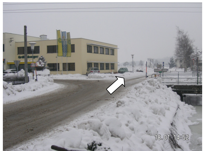
folgen Sie dem Straßenverlauf (siehe Wegweiser) gerade aus