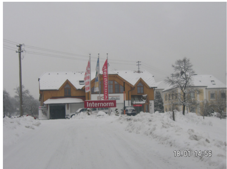
Ziel erreicht - Fa. Bau-Service Grabmann