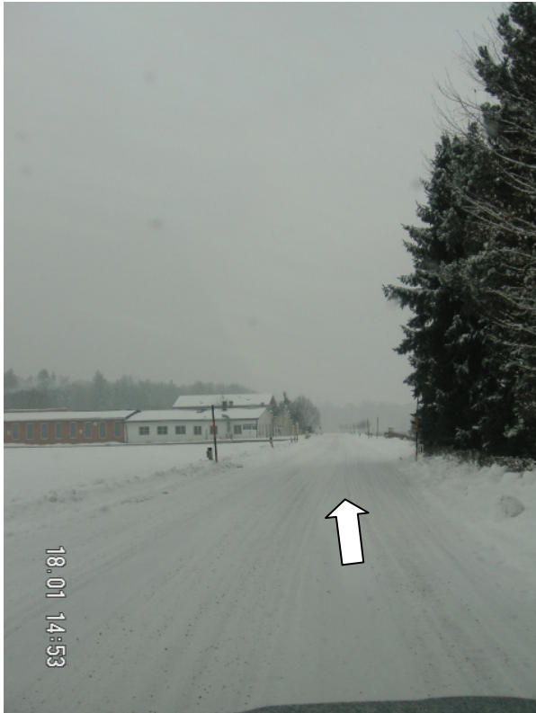
folgen sie dem Straßenverlauf (ca. 1km bis Ortseinfahrt Mettendorf)